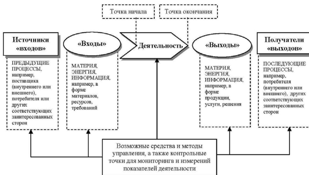
Рис. 1. Схематичное представление элементов единичного процесса

На рис. 1 схематично изображен любой процесс и показаны взаимосвязи между его элементами. Точки мониторинга и измерений, которые необходимы для управления, конкретны для каждого процесса и будут варьироваться в зависимости от связанных с этим рисков.